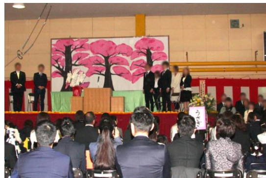
A.L.C.貝塚学院 2019 年度入園式 風景 1