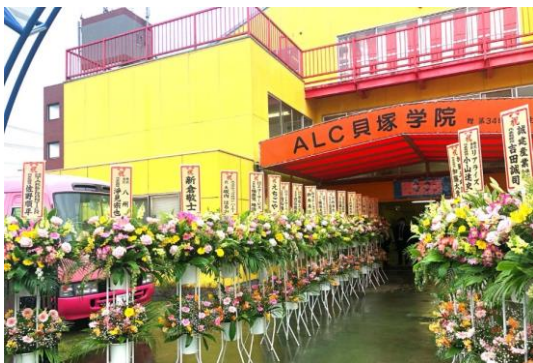
A.L.C.貝塚学院 田島校舎 2019 年度入園式 外観

2019 年 4 月 8 日、新園児 46 名と保護者が参列し 2019 年度入園式を迎えることができました。また、4 月 6 日に新園長に就任した織戸からは、「世界で活躍する人材に育てていただくため、正しいと思ったことを躊躇せずやる。積極的に手を挙げ、正しいと思った行動を取り続けていく姿勢を園児の皆様には身につけていただきたい旨」を祝辞として送りました。