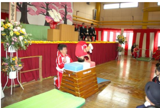
A.L.C.貝塚学院 2019 年度入園式 風景 2